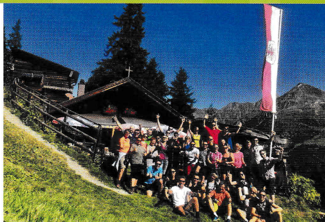
■ ■ ■ Ankunft an der Bratkartoffelhütte

Am Sonntag stand eine gemeinschaftliche Wanderung zur Bratkartoffelhütte Goldegg Alm auf dem Programm. Nach einem kernigen Aufstieg wurden wir mit einer herrlichen Sonnenterrasse belohnt, von der wir uns nur schwer