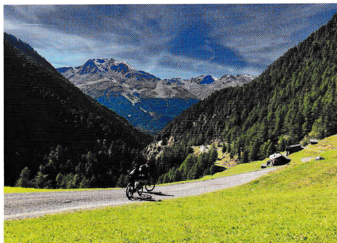
■■■ Herrliche Aussicht

Am Samstag wurde je nach Gusto in Kleingruppen gewandert oder Mountainbike gefahren. Manche radelten stramm bergauf (teils mit, teils ohne e-Unterstützung), andere waren eher Downhill orientiert, gondelten hoch und genossen die rasanten Abfahrten. Wir sind das eben so vom Skifahren gewöhnt.